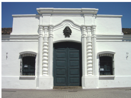
Casa de Tucumán