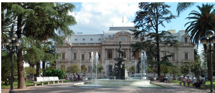
Casa de Gobierno